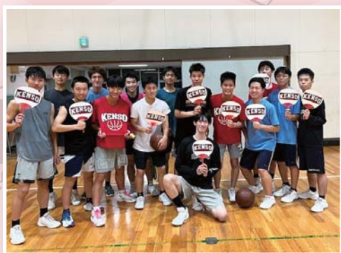
男子バスケットボール部 「応援用防水うちわ」

どの団体からも素晴らしい活動の内容がよく伝わるアピールが行われ、県相生の底力を感じることができました。この活動は今後も継続する予定です。