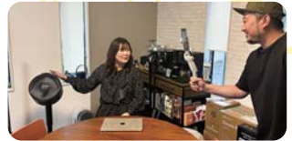
自宅は常に最新家電の山！ TikTokの撮影も行っています