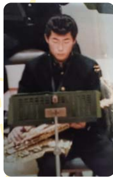
吹奏楽部では テナーサククスを担当

4月より代表取締役社長に就任しました。社業の発展はもとより、地域社会へ貢献し、社員とともに成長できる企業であり続けるように、またその基盤をしっかりと次世代につなげるようにしていきたいと考えています。一緒に働ける仲間を随時募集しておりますので興味のある方は弊社ホームページをご覧ください。だきご連絡いただければ幸いです。