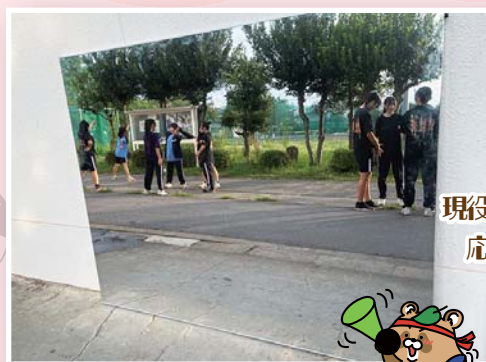
応援団部 「練習用の割れない大鏡」