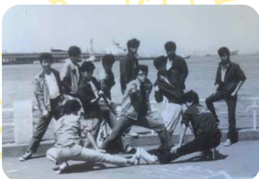
映画のワンシーン

在校生には、是非、小学校の教員をめざしてほしいと思っています。人生のなかで小学校時代が、心も体も一番成長する時期です。小学校教員は、そんな子どもたちと一緒に過ごすことができます。そして、素敵な仕事です。