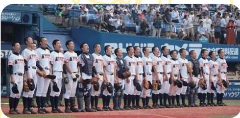
横浜高校に勝利し校歌を歌う選手たち

令和6年4月から社会人になるので、先輩方の言つことを吸収し、一人前の社会人になれるように必死にやっています。良い仲間を見つけて充実した時間を過ごしたい。