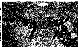
150名が集まった8期会

い友の顔を見るやいなや、 皆、大変な盛り上がり様で すでに会のボルテージは最 高潮。篠崎先生の音頭によ る乾杯の後は各先生方を酒 の肴にしよとの提案で先 生方全員前の壇上へ。そこ で近況報告やら、今だから 話せる昔話やら、そして各 クラス毎の写真撮影、有志 持ち寄りの景品の抽選会な ど二時間半の予定が三時間 に、さらに同所二階のレス トランでの二次会にも予想 を上回る九十名の参加にと れこの会の成功ぶりが伺 えます。またこの機会にと クラス会の日時を決めるク ラス会の日時を決めるク ラス会の日時がありました。 三次会以降と繰り出すグ ループも相当数ありそれぞ れの愛らぬ友情を感じさせ た。また、この会の席上で 「八期会基金」の設立が発 表され、五年後の第二回八 期会にその使途を決定す る事などを出席者全員の賛 同を得て承認されました。 6ヶ月の準備期間と多数の 協力者の努力により開催さ