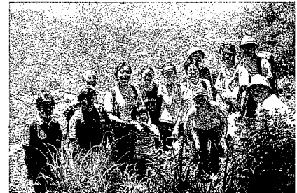
ワンダーフォーゲル部OB会

飲んだり、月に一度は、どこかへ誰かが出かけています。登山というハードなスポーツに明け暮れているとは、おもむきが若干違っているかもしれませんが、その頃の連帯感と、おもむきがあるの、このささやかな活動を支えているのだと思えます。仕事をもち家庭をもち、山から少し遠い生活をしていても、再び戻ってこれる、そんな山の会を、OB会は志向しています。あなたも、第一土曜日の大野北公民館で、あの頃の少年少女に戻ってみませんか。