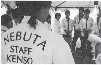
打ち合わせをする県相生

協力の内容は、カーニバル全般の管理・運営補助及びアナウンスの仕事依頼でした。実施運営マニュアルは40ページから構成され、参加者約3,000人の整理・誘導でした。開催が迫っていた関係で、生徒会を通じて全校生徒に呼びかけはできず、今年度は水泳部が対応しました。また、同時に吹奏楽部が参加を希望し、会議の結果、開会式が始まる前に市役所で演奏することが決まりました。また、授業中にこの話をしたら、最後に1人の男子生徒が「先生、興味があります。できたらアナウンス、挑戦してみたいのですが...」と言ってくれました。とても嬉しくて彼を採用しました。